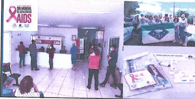
Campanha de Prevenção a AIDS e ao Câncer Bucal