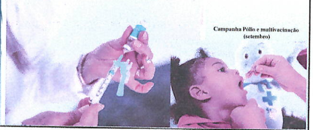
Campanha Pólo e multivacinação (setembro)