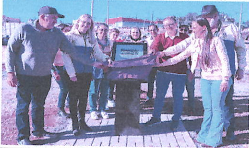
Prefeitura e Lions Clube homenageiam as 114 vítimas da Covid-19 em Laranjeiras do Sul