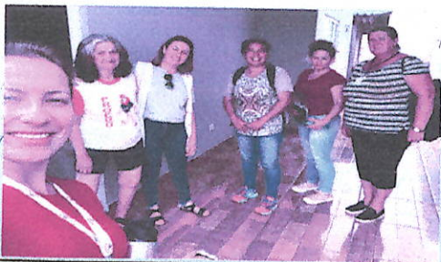
Saúde com Agente - Formação de ACS