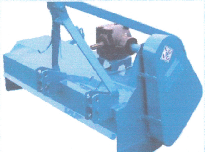
TRITURADOR PARA CAMA DE AVIÁRIO