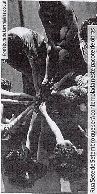
Prefeitura de Laranjeiras do Sul